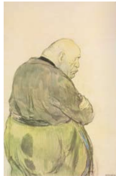
Рис.1. Кукрыниксы. «Муссолини». 1943

При просмотре агитационных плакатов и политических карикатур периода Великой Отечественной войны происходит погружение в ту атмосферу, можно ощутить и проследить настроения народа, с помощью цветовой гаммы и образов, которые смотрят на нас с плакатов и карикатур.