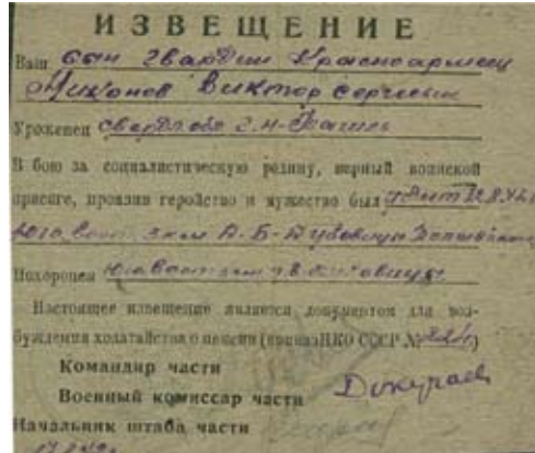
Извещение о смерти («похоронка»)