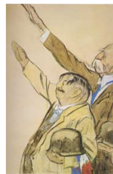
Рис.4. Кукрыниксы. «Лаваль и Петен». 1943 г.