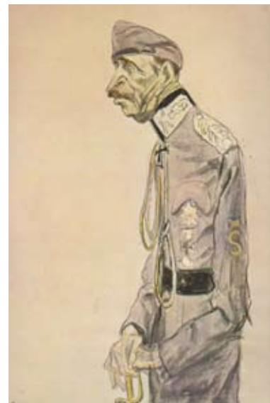
Рис.3. Кукрыниксы. «Маннергейм». 1943 г.