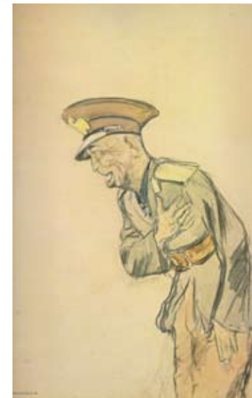
Рис.2. Кукрыниксы. «Антонеску». 1943